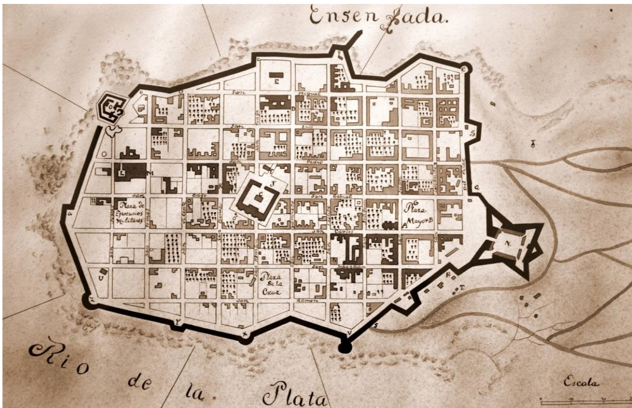
Montevideo Antigo. Plano de Juan de los Reyes; 1800. En el Cabildo de Montevideo.

Museo de las Migraciones. El sistema defensivo de Montevideo Antigo. Exposición fotográfica y de hallazgos arqueológicos llevada a cabo, en marzo de 2012, en el Museo de las Migraciones, ubicado en Montevideo, Bartolomé Mitre 1550, esquina Piedras.