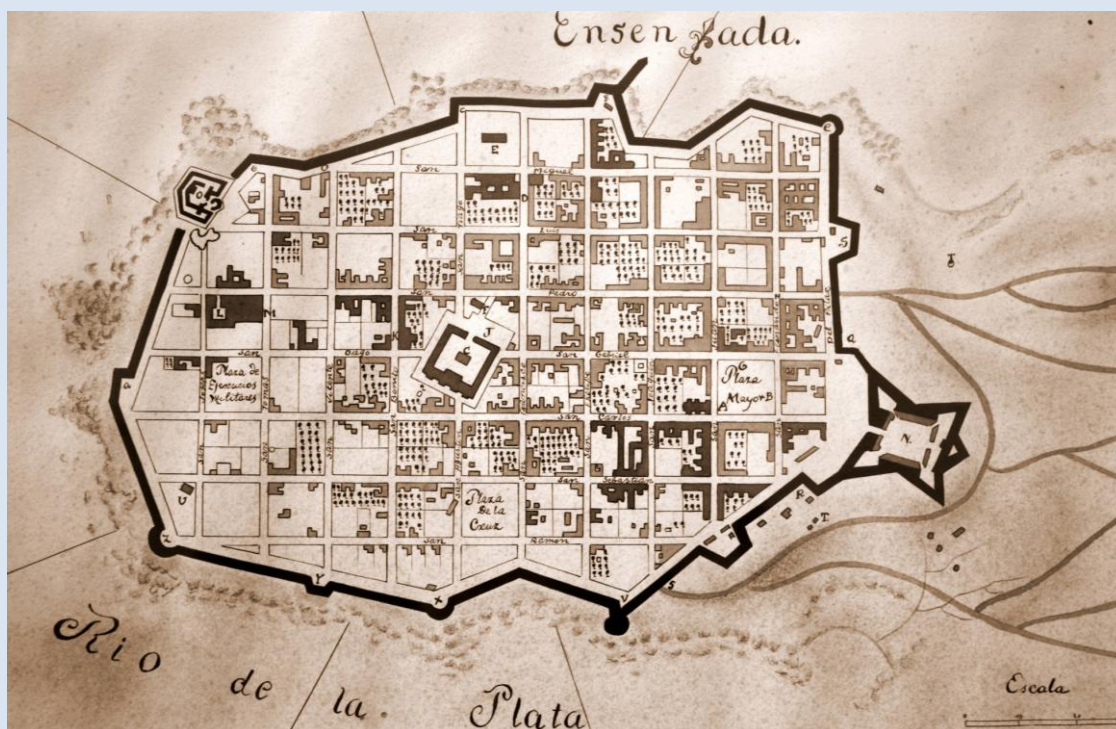
Montevideo Antiguo. Plano de Juan de los Reyes (1800), en el Cabildo de Montevideo