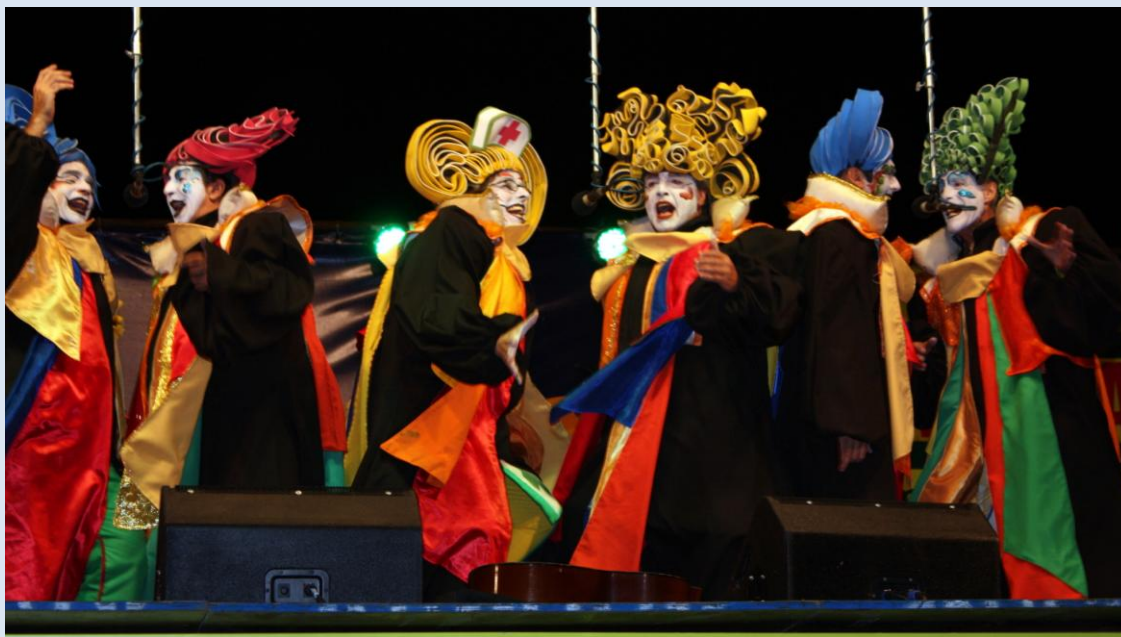
Cantando leyendas. Murga "A Contramano" en solidaridad con Madres y Familiares de Detenidos Desaparecidos (25/02/2013)