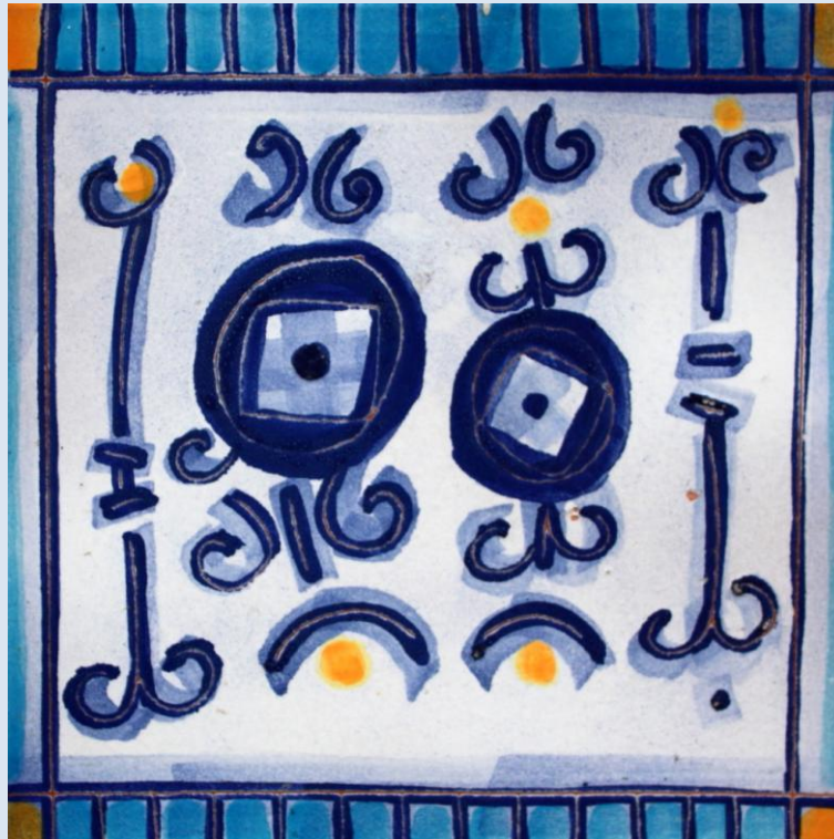
Azulejo en el Barrio Reus Norte, Montevideo