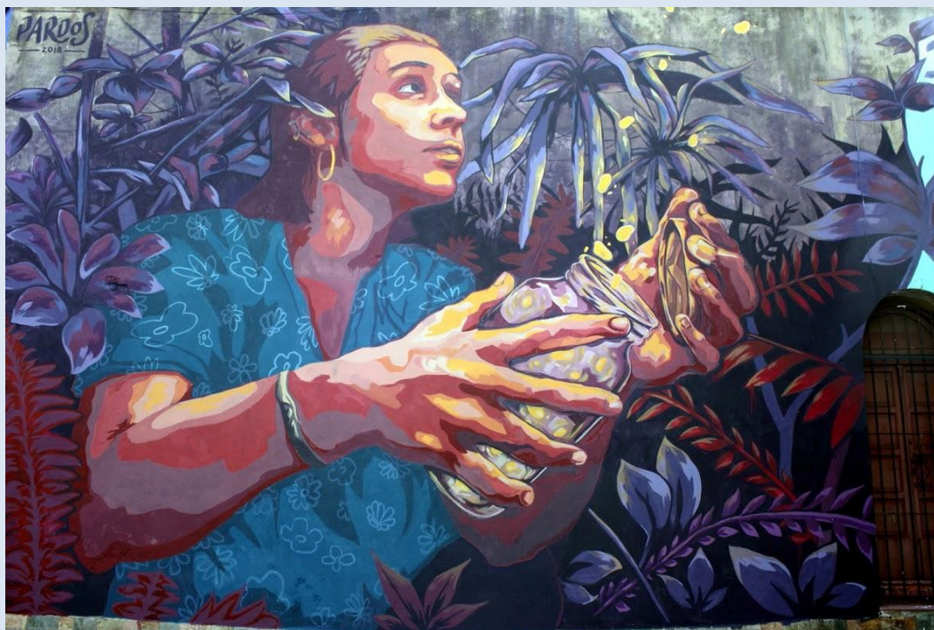
Liberando luciérnagas. Mural, obra de Pardos Calle Acevedo Díaz, esquina Miguelete. Montevideo